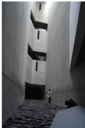
Daniel Libeskind: Jewish Museum Berlin