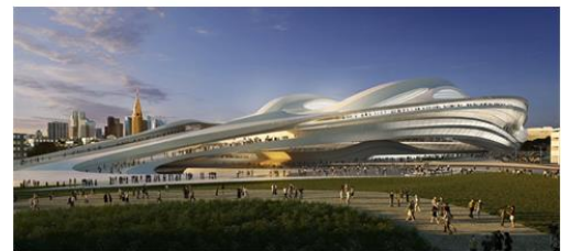
Zaha Hadid: 国立競技場